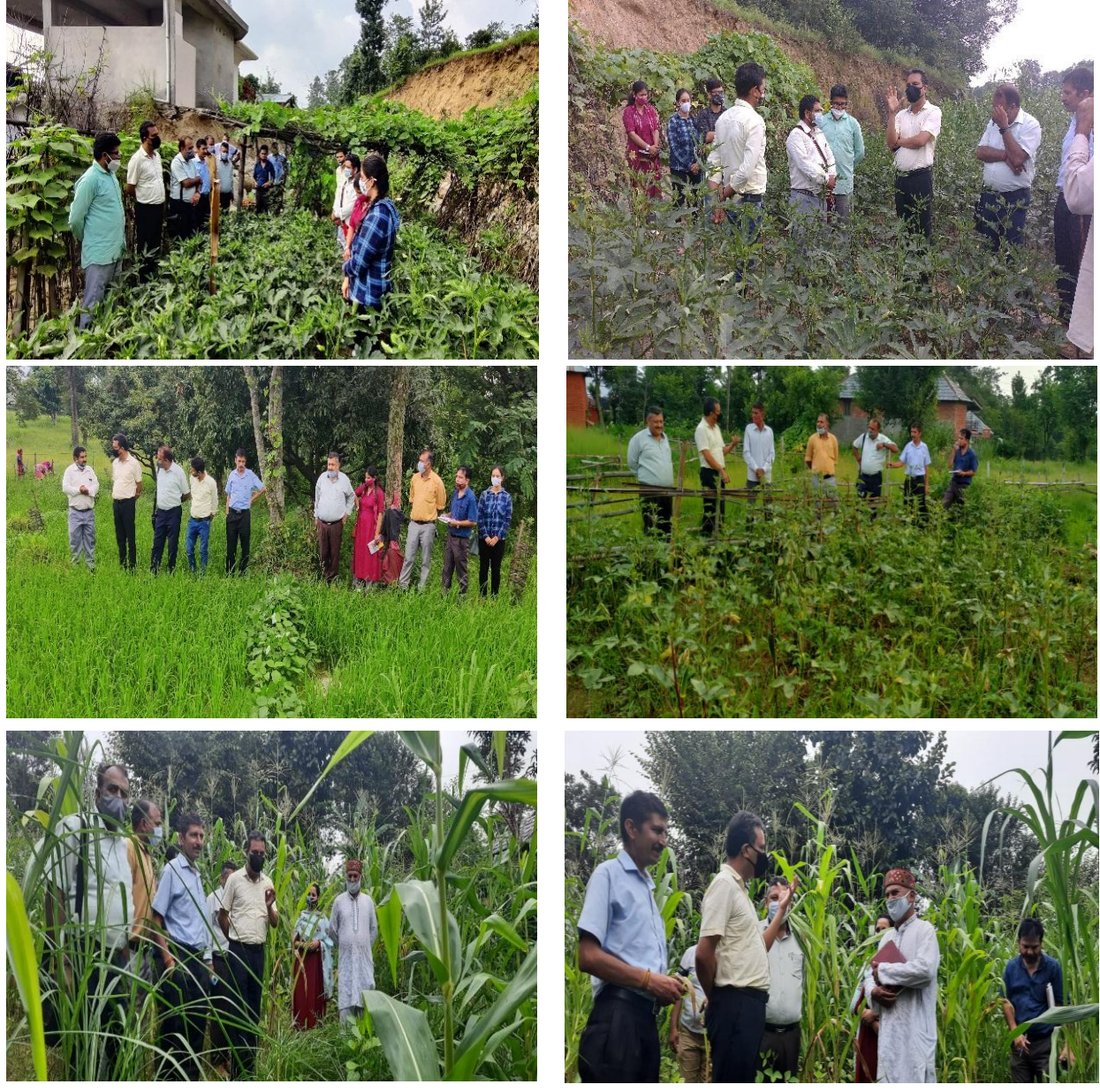
Bhawarna, Bhedu Mahadev and Lambagaon block in Distt. Kangra (6<sup>th</sup> August 2021)

6. Visit of faculty to farmers' fields of Kangra district