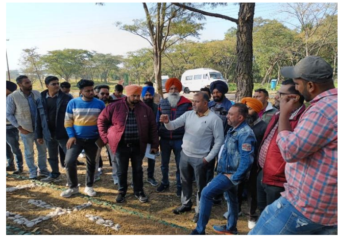
Farmers from Mansa, Punjab's visit ( 25<sup>th</sup> November 2021)