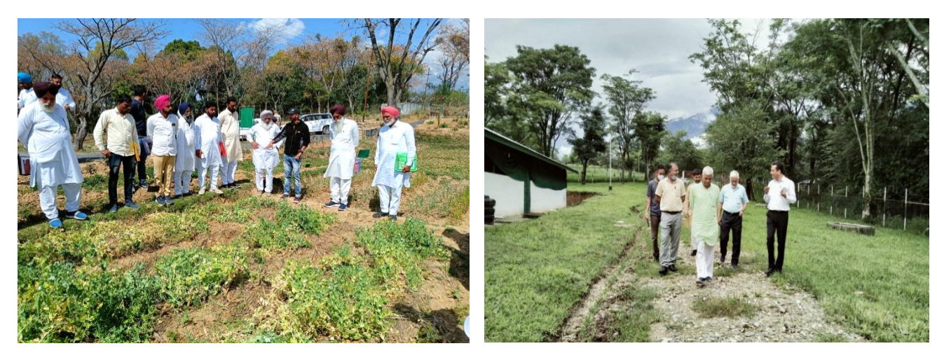
Farmers from Hanumangarh's visit (15<sup>th</sup> March, 2022)