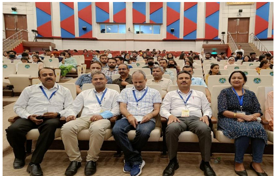
Faculty of the department attending the 1<sup>st</sup> Zonal Convention on 'Natural Farming: A National Priority for Human Health and Ecological Restoration' held from 5<sup>th</sup> to 6<sup>th</sup> April 2022 at SKUAST- Jammu