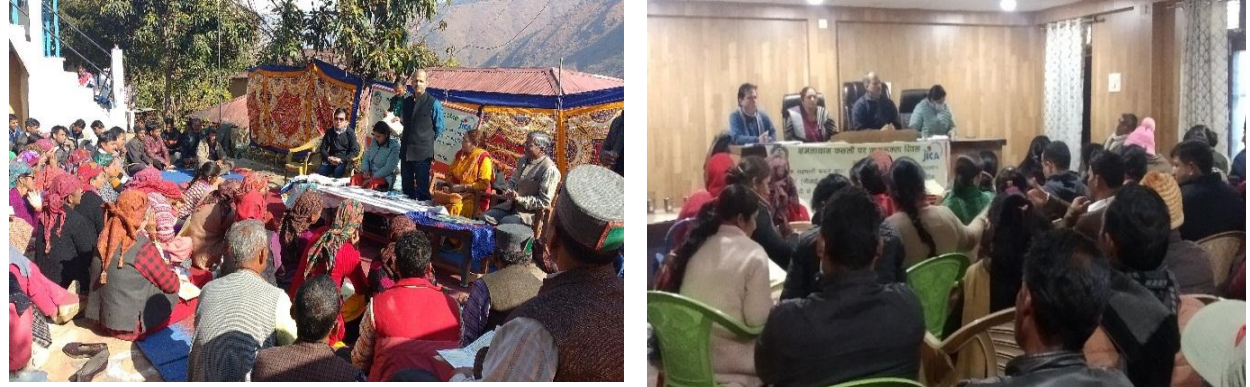
Training progarmme at G.P. Naanj and Kelodhar, Karsog valley, Distt. Mandi (22-23<sup>rd</sup> December 2021)