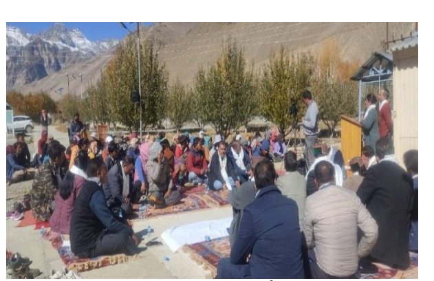
Field day at Lari, Lahaul-Spiti (9th November 2021)