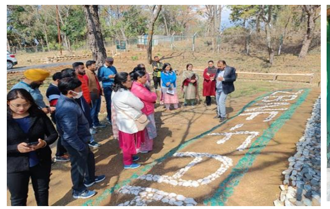
ADOs from Deptt of Agriculture, H.P.'s visit (4<sup>th</sup> March, 2022)