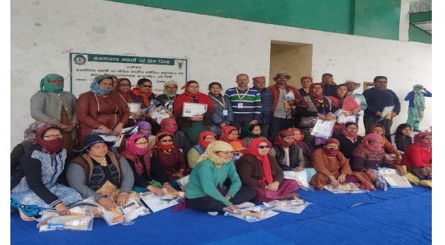
Field day at Trilokinath, Lahaul-Spiti (16thApril 2022)