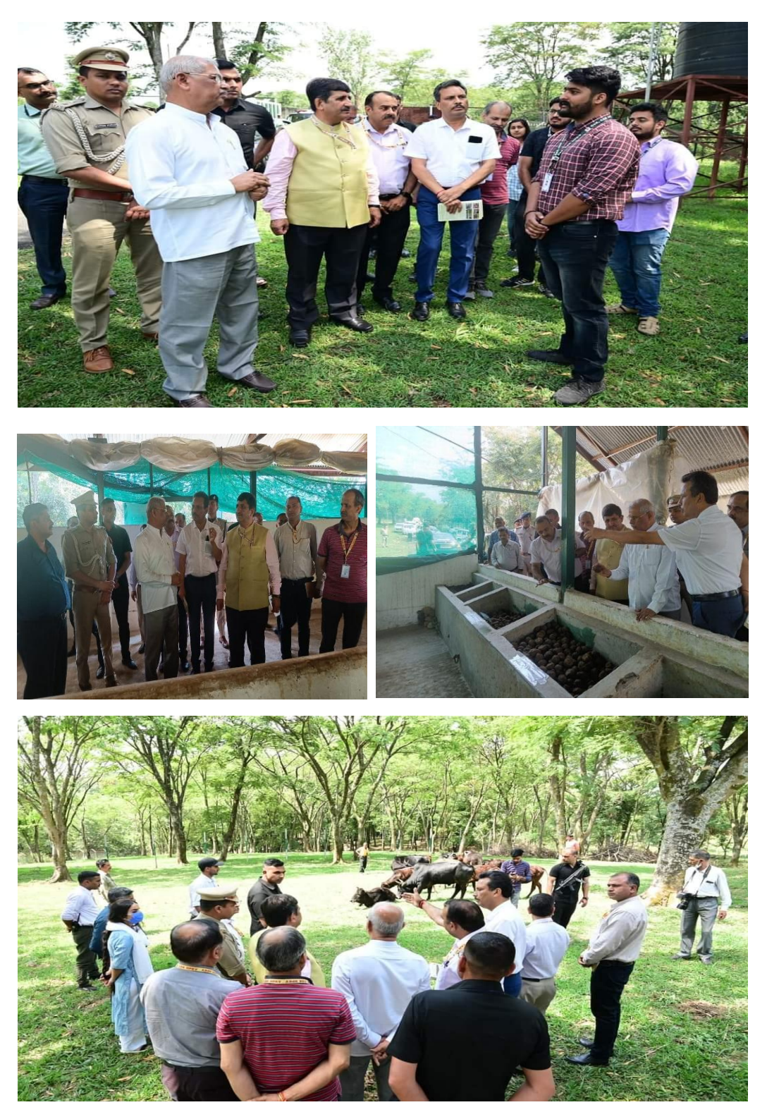
His Excellency, Hon'ble Governor, Sh Rajendra Vishwanath Arlekar's visit (17th May 2022)

1. Visit of VIPs at Zero Budget Natural Farming (ZBNF) Centre