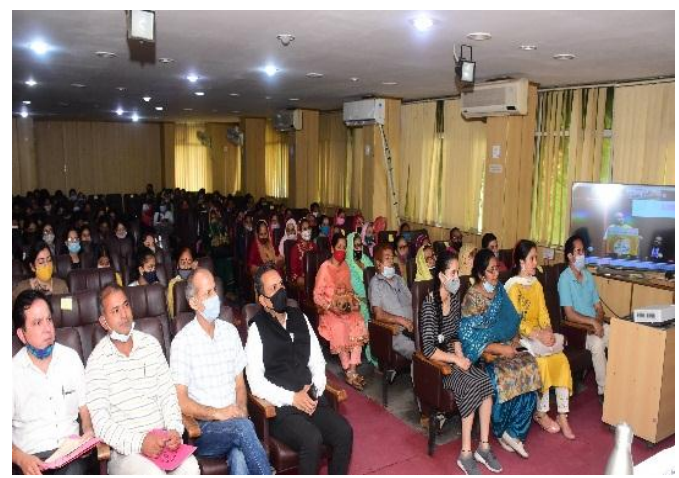
Online inaugural of 'International Year of Millets 2023'