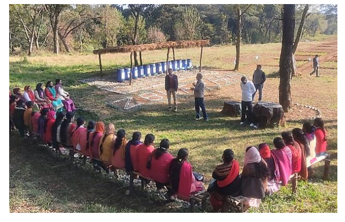
Farmers from Hamirpur & Chamba District's visit (10<sup>th</sup> March, 2022)