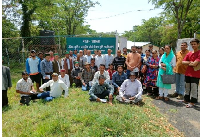
Farmers from Nagrotra Bagwan's visit (22<sup>nd</sup> April, 2022)