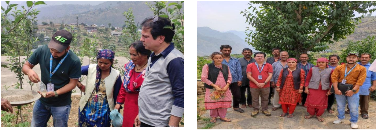
Gram Panchayat Kelodhar and Naanj, Karsog valley, Distt. Mandi (26th- 27th May 2022)