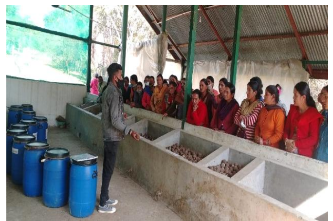
Farmers from District Mandi's visit (7<sup>th</sup> April, 2022)