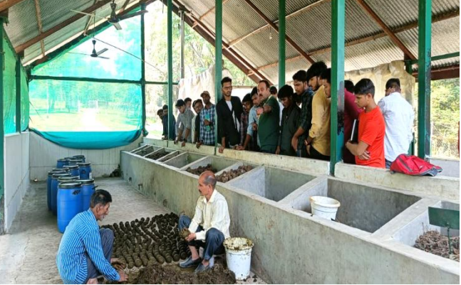
Farmers from Hamirpur District's visit (7<sup>th</sup> March, 2022)