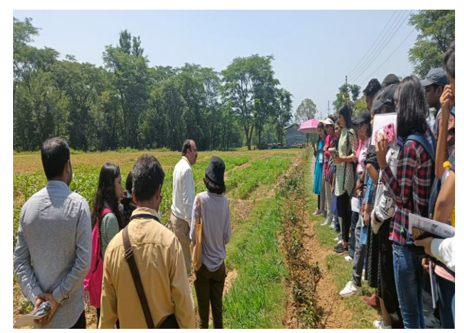
Students of Shivaji College, University of Delhi's visit (25<sup>th</sup> June 2022)