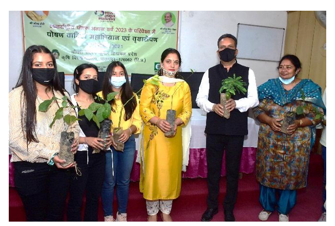
Distribution of plants to the farmers and girls during Poshan Vatika