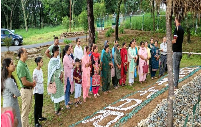
Farmers from Samra, Distict Solan's visit (13<sup>th</sup> March, 2022)