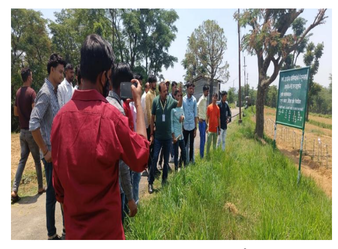
Students from Meerut college's visit (3<sup>rd</sup> June, 2022)